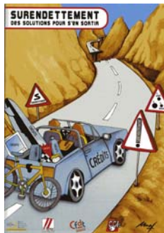
Le guide du débiteur

Pour recevoir le bon de commande, merci de remplir le formulaire et nous le retourner ALLDC 153 avenue Jean Lolive 93695 Pantin Cedex