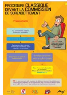
L'exposition sur le surendettement Exemple de panneaux disponibles